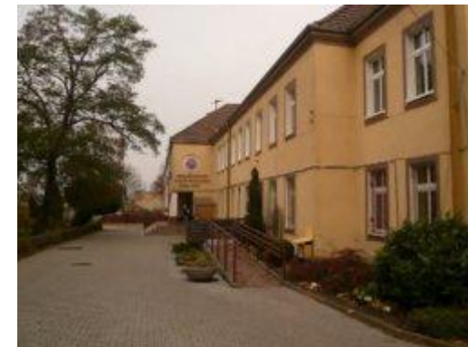
Fot. Budynek szkolny

Szkoła Ogrodnicza w Szczecinie Zdrojach powstała 15 października 1946r. na bazie przedwojennego doświadczalnego obiektu ogrodniczego, którym od 1924 do 1945 roku kierował dyplomowany ogrodnik Kurt Holder-Egger. Początkowo była to szkoła Rolniczo - Ogrodnicza. W 1949r. powstaje Liceum Ogrodnicze, które w roku szkolnym 1951/1952 zostaje przekształcone w Technikum Ogrodnicze, a w 1964/1965 powstaje Zasadnicza Szkoła Ogrodnicza. Podczas uroczystych obchodów 30-lecia istnienia, Szkole nadano imię Saperów Wojska Polskiego. W roku 1979 na bazie dotychczas działających szkół powstał Zespół Szkół Ogrodniczych, a od 2011 roku Centrum Edukacji Ogrodniczej.