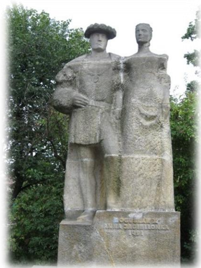
Fot. Pomnik Bogusława X i Anny Jagiellonki przy Zamku Książąt Pomorskich w Szczecinie

W czasie swego panowania przeprowadził wiele bardzo ważnych reform wewnętrznych. Miały one zapewnić krajowi ład i bezpieczeństwo wewnętrzne, umocnić władzę książęcą i przyczynić się do rozkwitu księstwa. Cele te osiągnął książę przez zreformowanie dworu książęcego, powołanie centralnej administracji, utworzenie książęcej kancelarii, sądu nadwornego i urzędu marszałka. Był Bogusław X dobrym gospodarzem, ożywił handel gwarantując kupcom bezpieczeństwo na drogach, uporządkował finanse tworząc mennicę książęcą, wzmocnił siłę obronną państwa. Dbał o rozwój życia umysłowego i kulturalnego. Bogusław X w historiografii pomorskiej wyróżniony został przydomkiem „Wielki”, bo rzeczywiście zarówno swych poprzedników jak i następców