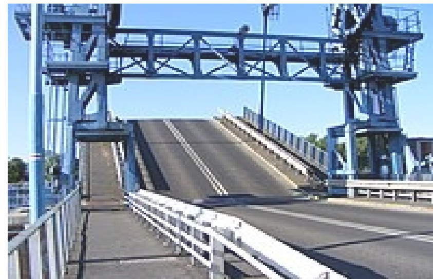
Most podnoszony w Dziwnowie